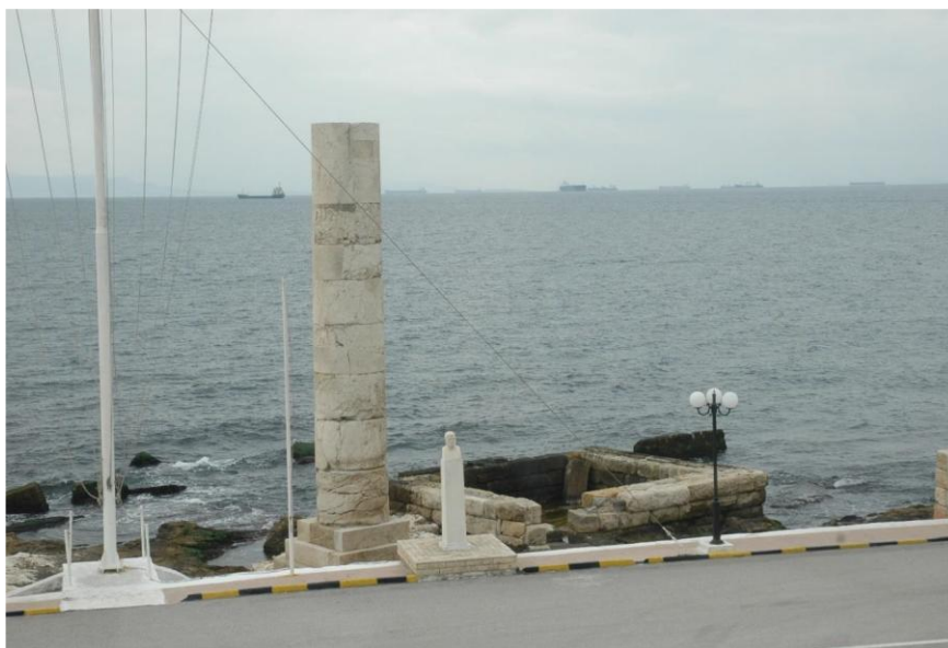
Εικ. 1.2 Ταφικό Μνημείο Θεμιστοκλή στην είσοδο του λιμένα.

Η θέση του συνόλου των μνημείων, στο νότιο τμήμα των λιμενικών εγκαταστάσεων, αποτυπώνεται στην ακόλουθη αεροφωτογραφία.