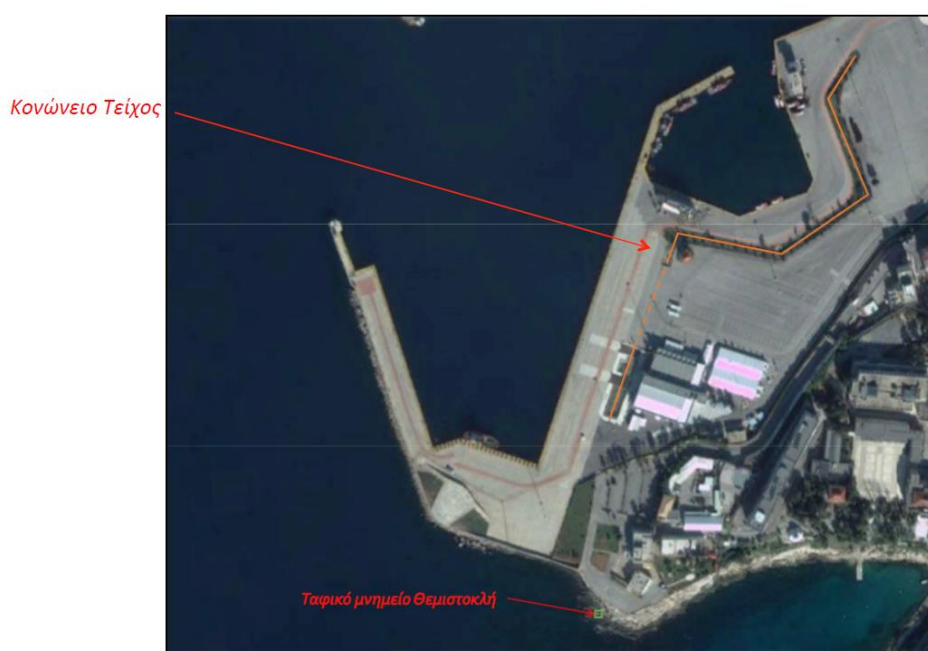
Εικ. 1.3 Θέση Κονώνειου Τείχους και Ταφικού Μνημείου Θεμιστοκλή.

Η θέση του συνόλου των μνημείων, στο νότιο τμήμα των λιμενικών εγκαταστάσεων, αποτυπώνεται στην ακόλουθη αεροφωτογραφία.