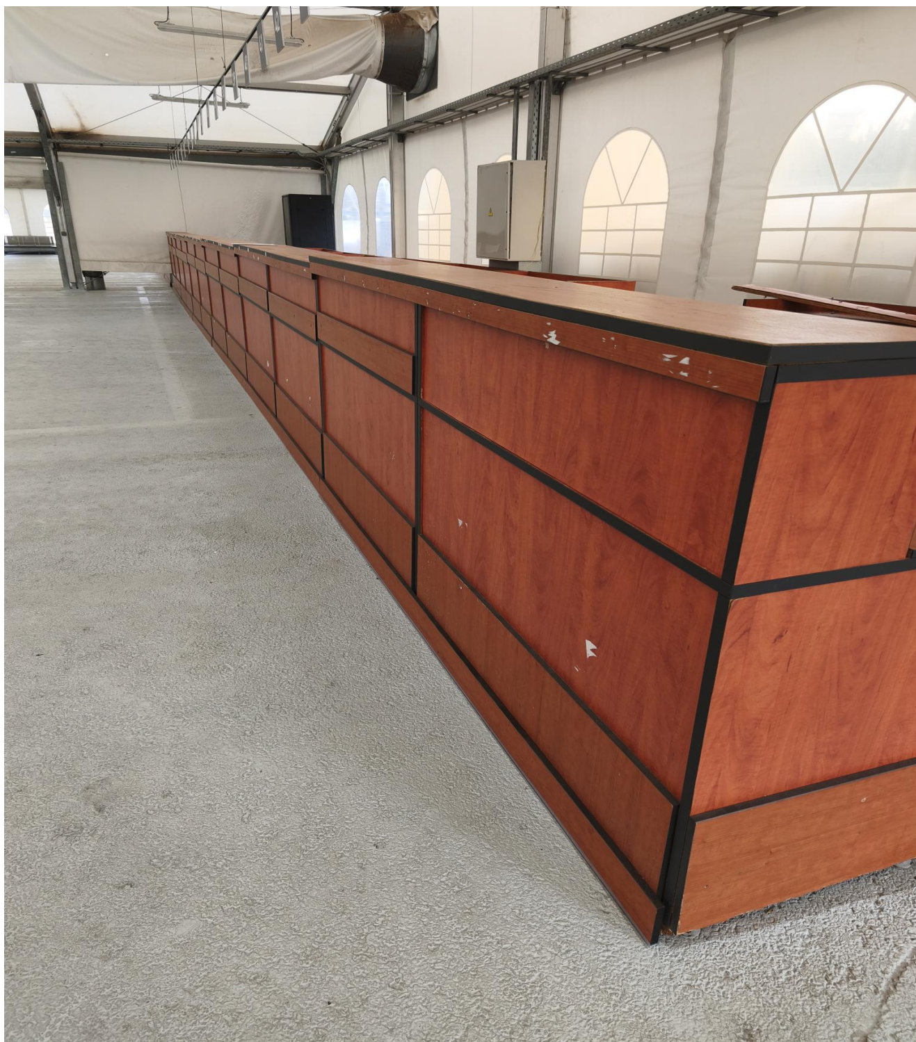
Εικόνα 2 Τωρινά γραφεία υποδοχής