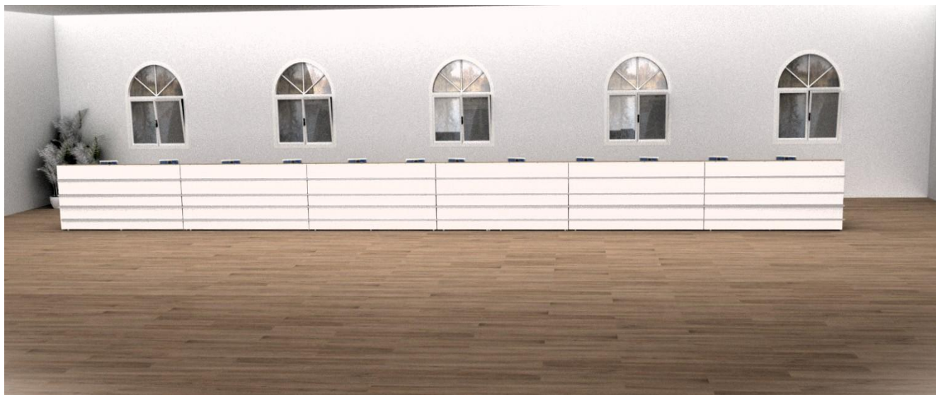
Εικόνα 3 Ενδεικτικά νέα γραφεία υποδοχής