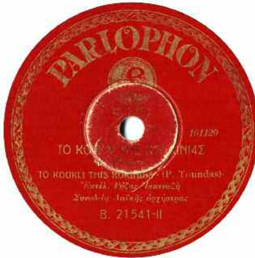
Το κουκλί της Κοκκινιάς Ρόζα Εσκενάζ Parlophon B 21541, Αθήνα 1930

Κλαίγω μυστικά, κουκλάκι μου μην το μάθει ο ντουνιάς ότι για σένα λιώνω και πονώ, μικράκι μου όμορφο κουκλί της Κοκκινιάς